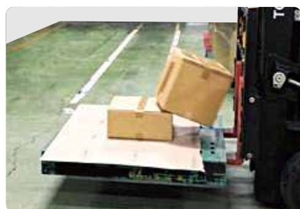
ストツパくん®未使用